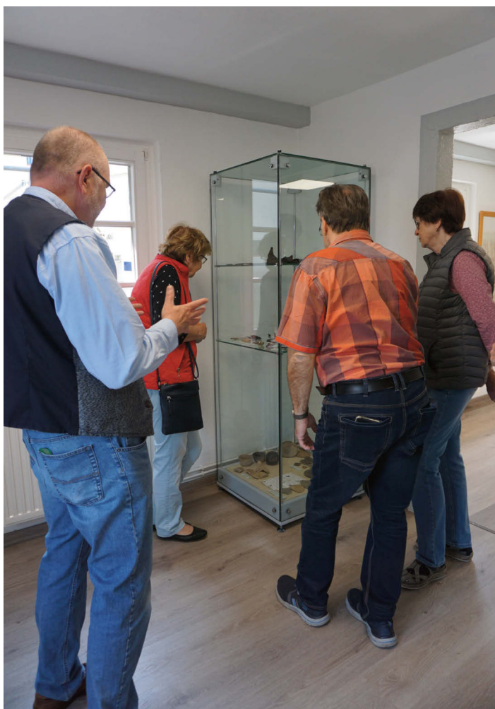
Besucher zum Tag der offenen Tür.

male Repräsentation der Ausstellungsgegenstände ist noch nicht abgeschlossen. Uns ging es darum, dass es trotz Schließzeit des Museums für die Mitarbeiter bzw. den Mitgliedern des Förderkreises Alte Mädchenschule keine Pause gab. Das Obergeschoss des Alten Museums beherbergt nun eine Geologische Abteilung, welche sich mit dem industriellen Abbau von Gesteinen in unserer Region befasst. In zwei weiteren Räumen werden Bodenfunde von der Älteren Steinzeit bis zum Mittelalter gezeigt. Die Mügelner Region ist bekannt für seine reichen Bodenfunde! Die letzte Abteilung befasst sich mit überregional bekannten Persönlichkeiten, die entweder in Mügeln geboren oder aufgewachsen waren. Alte Mügelner Ansichten zieren den ebenfalls sanierten Treppenaufgang.