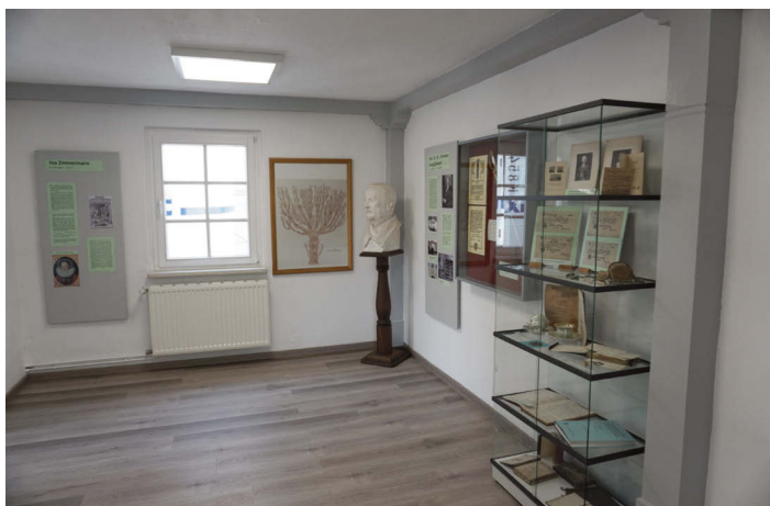
Die neue Ausstellung zu Mügelner Persönlichkeiten. (A. Lobe)

male Repräsentation der Ausstellungsgegenstände ist noch nicht abgeschlossen. Uns ging es darum, dass es trotz Schließzeit des Museums für die Mitarbeiter bzw. den Mitgliedern des Förderkreises Alte Mädchenschule keine Pause gab. Das Obergeschoss des Alten Museums beherbergt nun eine Geologische Abteilung, welche sich mit dem industriellen Abbau von Gesteinen in unserer Region befasst. In zwei weiteren Räumen werden Bodenfunde von der Älteren Steinzeit bis zum Mittelalter gezeigt. Die Mügelner Region ist bekannt für seine reichen Bodenfunde! Die letzte Abteilung befasst sich mit überregional bekannten Persönlichkeiten, die entweder in Mügeln geboren oder aufgewachsen waren. Alte Mügelner Ansichten zieren den ebenfalls sanierten Treppenaufgang.